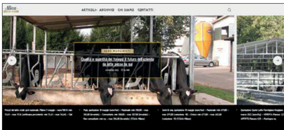
Alleva Web, l'home page

2 - Alleva Newsletter. È la newsletter del Consorzio per gli allevatori, con con notizie, aggiornamenti e spunti di attualità che coinvolgono il mondo della produzione primaria, flash tecnici, con-